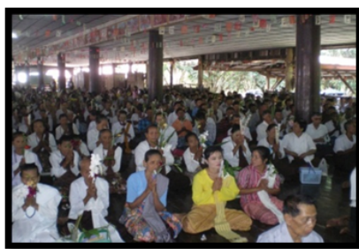
ภาพที่ 1: ภาพประเพณีบุญพรรษาชาวไทยเชื้อสายมอญบ้านวังกะ

1.2 ภูมิปัญญาด้านอาหารที่ใช้สืบทอดวัฒนธรรม ความเชื่อในงานวันสำคัญทางพระพุทธศาสนา เช่น ประเพณีวันเข้าพรรษาหรือชาวมอญบ้านวังกะเรียกกันว่าประเพณี บุญพรรษา ภาษามอญเรียกว่า (ก๊าวซอฮะเกิน) วันพระใหญ่ขึ้น 15 ค่ำเดือน 8 (วันอาสาฬหบูชา) ตรงกับเดือนกรกฎาคมเป็นงานประเพณีที่ชาวไทยเชื้อสายมอญบ้านวังกะในแต่ละครัวเรือนจะจัดทำขนมมนสาว หรือ ขนมเทียน ภาษามอญเรียกว่า (ก๊าวนกุฮะเตย) ไปถวายพระ และมอบให้ผู้ใหญ่ในชุมชนเพื่อเป็นการขอพรจากผู้ใหญ่ให้เกิดมงคลแต่ตัวเองและใส่ของขนมในแต่ละบ้านจะแตกต่างกันออกไป ชาวบ้านจะนำขนมแลกกันเพื่อเป็นการแลกเปลี่ยนสูตรของไส้ขนมเทียนต่างๆ