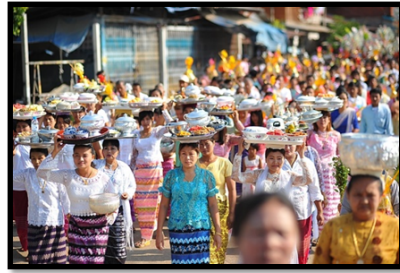
ภาพที่ 4: ประเพณีสงกรานต์มอญ

ขึ้นปีใหม่ เป็นวันที่เทวดาองค์ใหม่ เสด็จลงมารักษาลोकมนุษย์ ต้องทำศาลพร้อมเครื่องบูชาอาหารต้อนรับเทวดาองค์ใหม่ที่บริเวณหน้าบ้าน ก่อนถึงเทศกาลสงกรานต์จะทำความสะอาดบ้านเรือนเตรียมต้อนรับปีใหม่และญาติพี่น้อง วันที่ 12 และ 13 เมษายน ทุกบ้านเตรียมกับข้าวที่รับประทานกับข้าวแช่ ได้แก่ ปลาผัดกับมะม่วง วันที่ 14 15 และ 16 เมษายน ทุกครอบครัวทำข้าวแช่และอาหารไปทำบุญ