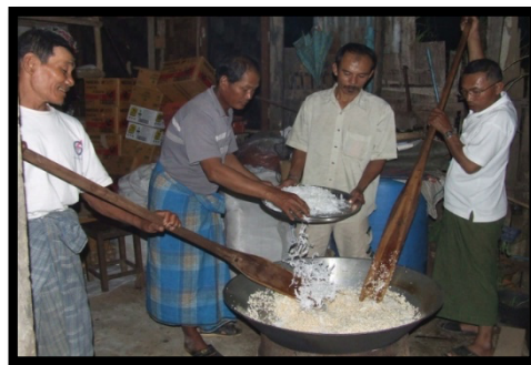
ภาพที่ 5: ประเพณีทำข้าวยาคุ

ประเพณีทำข้าวยาคุ เดือน สาม ตรงกับเดือนกุมภาพันธ์ชาวบ้านเก็บเกี่ยวผลผลิต จำพวก ข้าว งาม ถั่ว ร้อยแล้วจะร่วมกันทำข้าวยาคุในวันพระใหญ่ขึ้น 15 ค่ำ เดือน 3 (วันมาฆบูชา) ใส่บาตรตอนเช้าและแจกคนในชุมชน