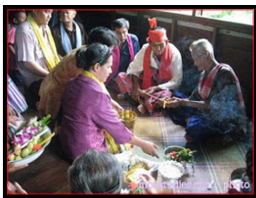
ภาพที่ 2: ประเพณีรับขวัญ

ในการทำที่ไม่ยุ่งยากแต่มีความหมายที่ดีตามที่ชาวบ้านในชุมชนเชื่อต่อๆ กันมา คือข้าวเหนียวคลุกมะพร้าว หรือภาษามอญเรียกว่า (ปะลอนสะบอน) ข้าวเหนียวคลุกมะพร้าวเป็นขนมนิยมทำขึ้นเมื่อมีงานบุญต่างๆ เช่น งานรับขวัญเด็ก งานทำขวัญนาค จะทำเพื่อแจกจ่ายกับคนที่มาร่วมงาน ชาวบ้านเชื่อกันว่าเป็นขนมที่ช่วยเพิ่มสิริมงคลให้กับตัวเอง เงินทองจะไม่รั่วไหล ดั่งการจับกลุ่มเป็นก้อนของข้าวเหนียว (สุมิตร ปุณณะการี, 2562, พฤศจิกายน, 2)